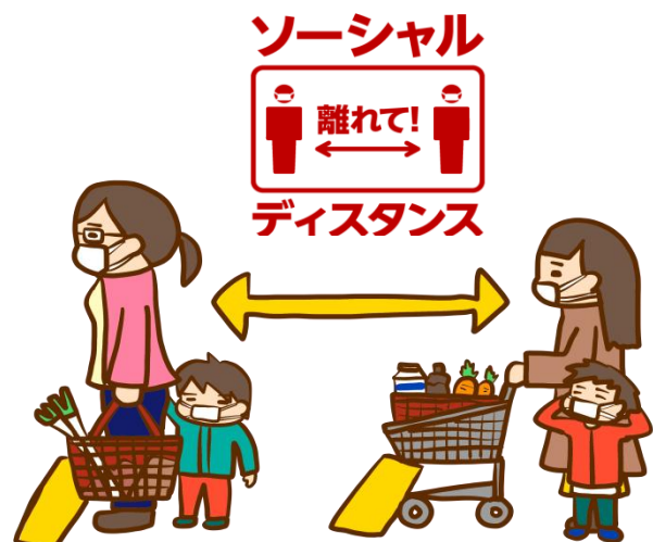
ソーシャル ディスタンス